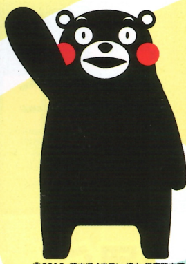
©2010. 熊本県くまモン 協力 銀座熊本館