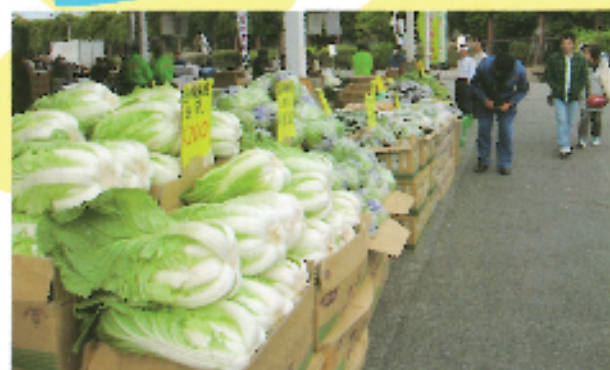
・特別価格で販売します。野菜・果物の模擬セリ