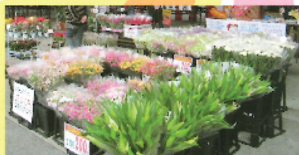
・切花・鉢物を特別価格で販売します。